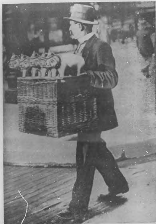
LA GUERRA EUROPEA.—Vendedor callejero, en París, de cochinitas, ridiculizando al Kaiser. Es un pintoresco aspecto del patriotismo francés, utilizando el ridículo como arma agresiva.