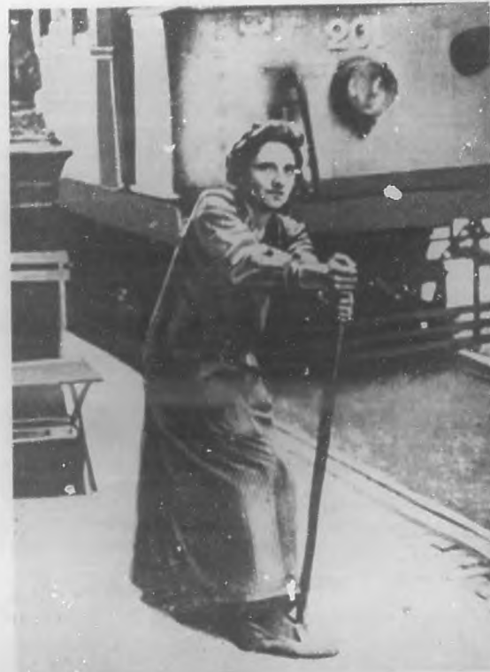
LA GUERRA EUROPEA.—Una mujer francesa haciendo el oficio de guarda-vías, en sustitución de los hombres que pelean por su Patria.

quien lo regenere ni restauro. Es admirable en la ductil sensibilidad humana la no extinción de los nobles ideales. No hay un agotamiento de voluntad en las más desesperadas sensaciones,