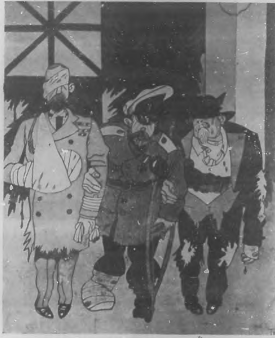
¡Y para esto nos habíamos aliado.....!