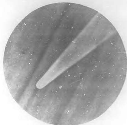
Aspecto telescópico del Cometa f-1913—através de gemelos prismáticos—Zeiss—8 veces—de una fotografía obtenida el día 22 de Septiembre a las 4 a m.

res—la cabellera no ha presentado aspecto aureolado desde que le estamos observando, sino de ser repelido con alguna