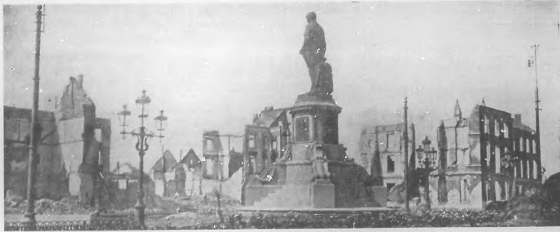
LA GUERRA EUROPEA.—Ruinas de la Estación y Hotel del Norte, en Lovaina destruída por los cañones alemanes.

tanto falaces, susceptibles de móviles pasionales o expresión de una labor de ayuda en un sentido o en otro. Se desconfió al fin de lo que se decía. Y hubo necesidad de que se realizase el máximo juicio de