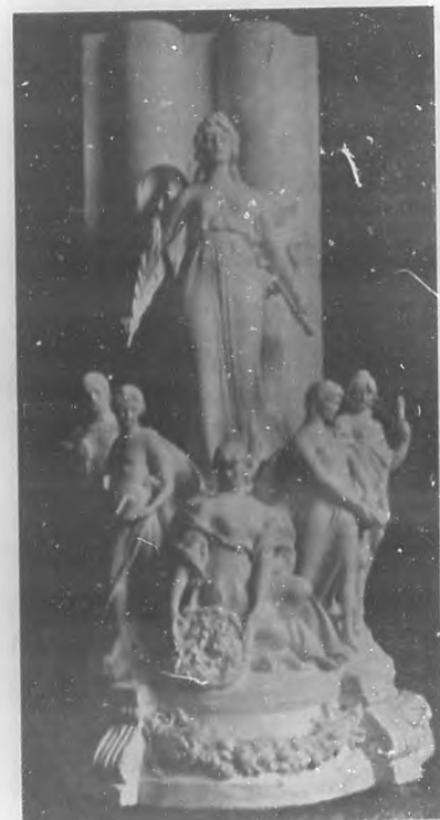
LA EDUCACION.—Boceto de la alegoría escultórica que ha de figurar en la fachada del Palacio del Centro Gallego, obra del escultor Moretti.

Todos los grupos se distinguen por lo es-