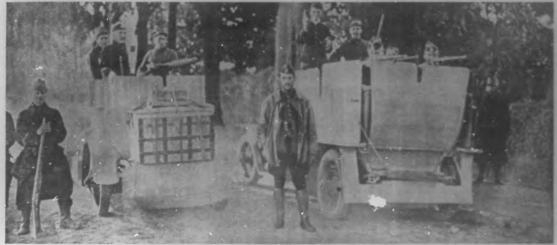
LA GUERRA EUROPEA.—Automóviles blindados del ejército belga que tan importante servicio han prestado en la defensa de su territorio.

Hay, mejor, como una espiritualización del sentimiento, se agigantan las idealidades en la derrota. La filosofía de la compasión nace de esta fuerza instintiva de amar lo consubstancial a nuestra vida. En las virtudes abstractivas hay un modo de fetichismo; en los hechos de dolor no hay más que heroísmos o martirios. Y ahí está la prueba, terrible, aplastante, apodictica en estas páginas.