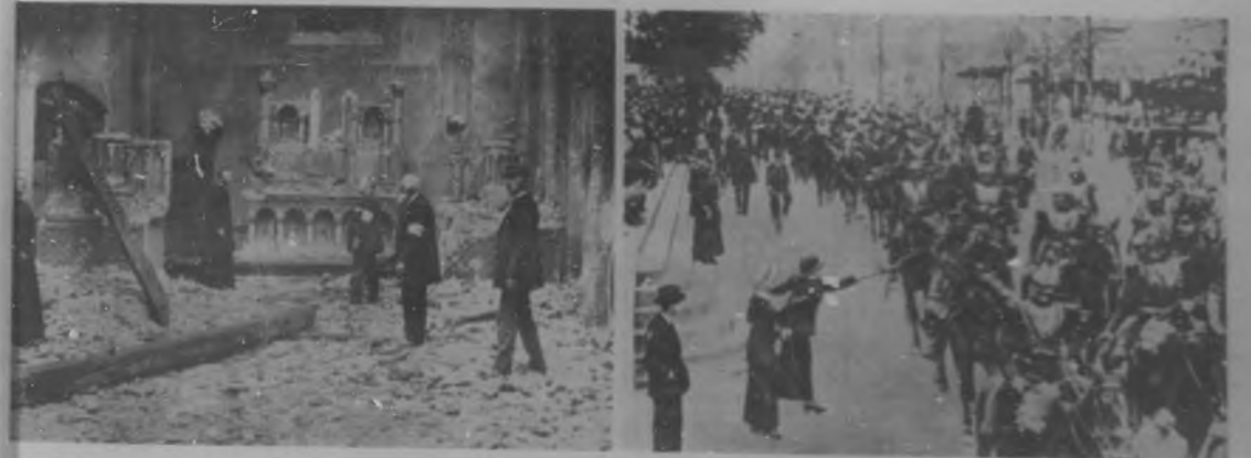
LA GUERRA EUROPEA.—Inspeccionando las ruinas de la artística Catedral de Malinas, en Bélgica, destruida por los alemanes.—Los soldados franceses, recibiendo regalos de las damas a su paso por los grandes boulevares de París.

El siglo veinte, siglo de las grandes ideas, siglo de las grandes palabras, y que lo