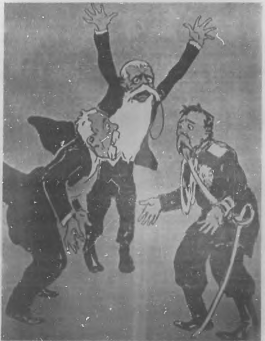
LOS ALIADOS:—Pero no habíamos quedado en que triunfábamos.