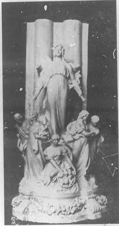
LA BENEFICENCIA.—Boceto de la alegoría escultórica que ha de figurar en la fachada del Palacio del Centro Gallego, obra del escultor Moretti.

de mármol. A estas últimas es a las que vamos a referirnos hoy, por ser las que completan los cuatro colosales grupos de mármol, que hechos en Italia, ha traído Moretti y comienza ahora a colocar en sus grandes pedestales.