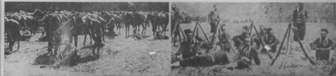
LA GUERRA EUROPEA: Caballería francesa en un descanso.—Destacamento de tropas senegalesas descansando después de un ataque a los alemanes.