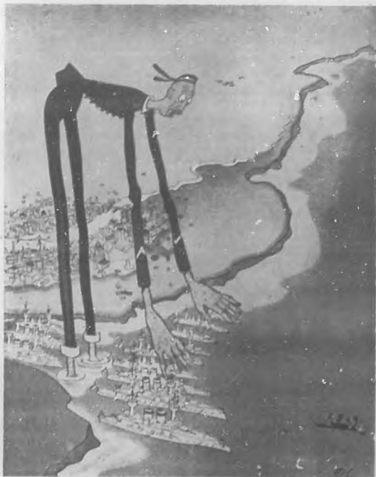
¡Uy, qué viene el coco...!!