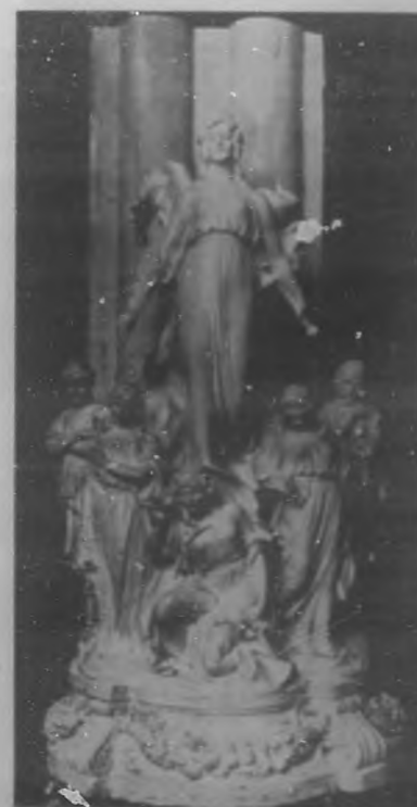
LA TRAGEDIA.—Boceto de la alegoría escultórica que ha de figurar en la fachada del Palacio del Centro Gallego, obra del escultor Moretti.