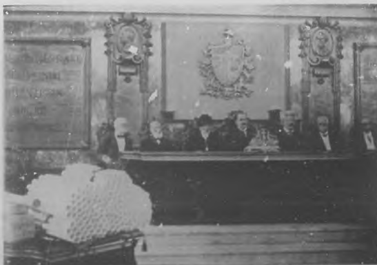
La Apertura del Curso Universitario.—Presidencia del solemne acto de la Apertura del Curso, celebrado con el ceremonial de costumbre, en el Aula Magna de nuestra Universidad Nacional.

Certamen de Caricaturas.—El 10 de Octubre se celebrará en los salones de la Academia Nacional de Artes y Letras la exposición de Caricaturas del genial Rafael Blanco.