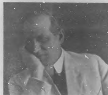
GIUSEPPE MORETTI.—Notable escultor italiano, actualmente huésped de esta Ciudad.

EN nuestro reducido ambiente artístico tenemos que dar cuenta hoy de algo que bien pudiéramos llamar un acontecimiento: la presencia en la Habana de un notable escultor extranjero, que viene a dejar entre nosotros fruto perdurable de su notabilísima obra artística. Nos referimos al Sr. Giuseppe Moretti, hijo de aquella Italia en la que el arte es una pasión nacional y que ha dado al patrimonio artístico del mundo sus joyas más preciadas. Moretti ha recorrido diversos países, en los que ha ido dejando, principalmente en Hungría y en los Estados Unidos, hermosos