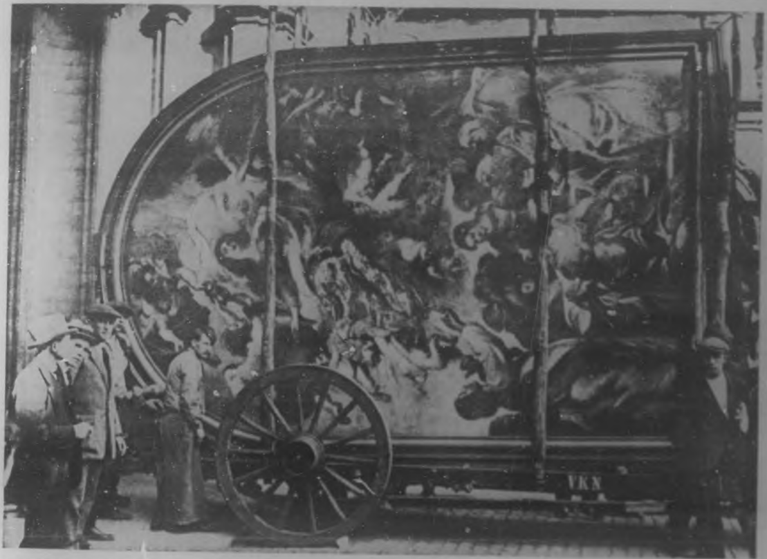
LA GUERRA EUROPEA.—Transporte del famoso cuadro de Rubens "La Asunción de la Virgen", desde la Catedral de Malinas, a un lugar seguro para preservarlo de la destrucción.

EN la intensa palpación humana que ha paralizado toda actividad que tiene la razón embotada por las fuertes sacudidas emocionales que espantan, por su hor-