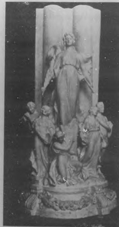
LA MUSICA.—Boceto de la alegoría escultórica que ha de figurar en la fachada del Palacio del Centro Gallego, obra del escultor Moretti.

Vino de tantos, que atraídos por la dulzura de nuestro clima, vienen a morar entre nosotros. Moretti visitó varias veces la Habana en cortas excursiones de placer, cuando por fortuna para nosotros, el arquitecto Sr. Torray, no ha mucho falleció, que le permitió su verdadera amistad, lo interesó para que se hiciera cargo de la labor escultórica del Palacio del Centro Gallego, que entonces comenzaba