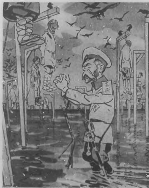
Mis queridos subditos:—En vista de los grandes favores que os he hecho espero que me ayudéis a defender la Patria.....!